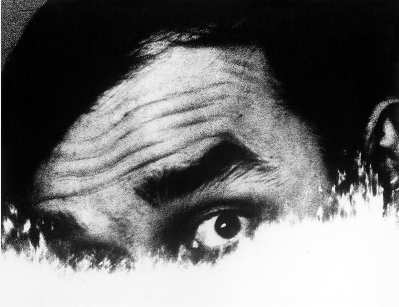
Portrait d'Yves Klein, 1960