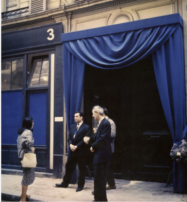
Yves Klein à l'entrée de la Galerie Iris Clert lors de l'inauguration de l'exposition du "Vide", Paris, 28 avril 1958