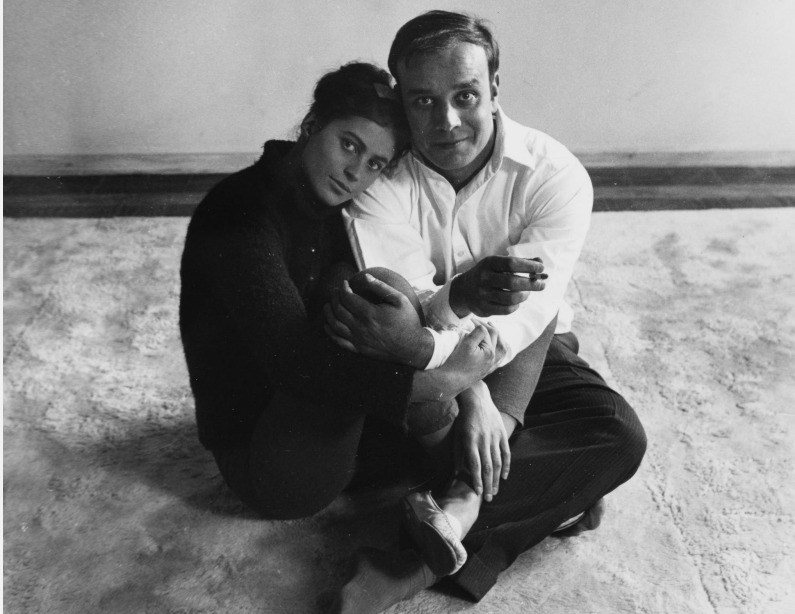
Portrait d'Yves Klein et de Rotraut Uecker, 1961