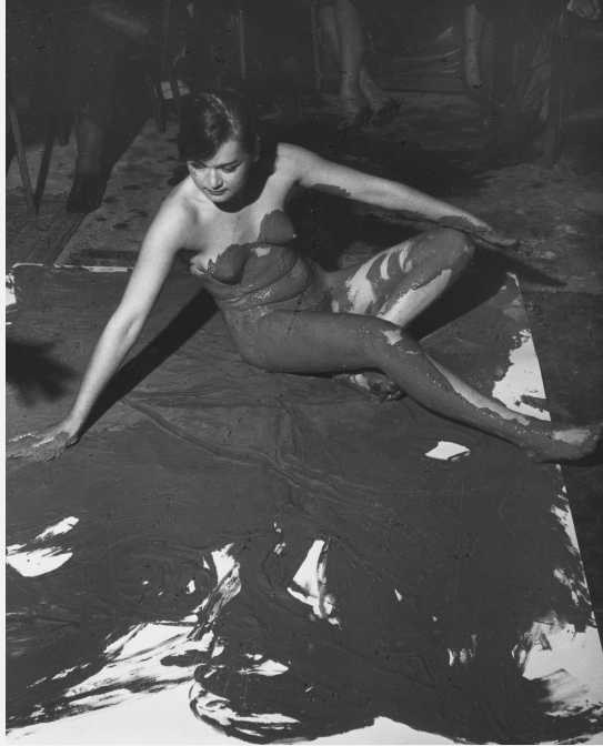
Yves Klein dans l'appartement de Robert Godet, 9 rue Le-Regrattier, Île Saint-Louis, Paris. Essai des pinceaux vivants, 1958