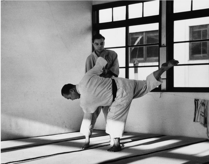
Yves Klein, démonstration de judo, Japon, 1953