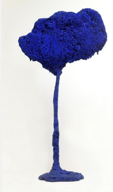
Yves Klein, SE71. L'Arbre, grande éponge bleue , 1962