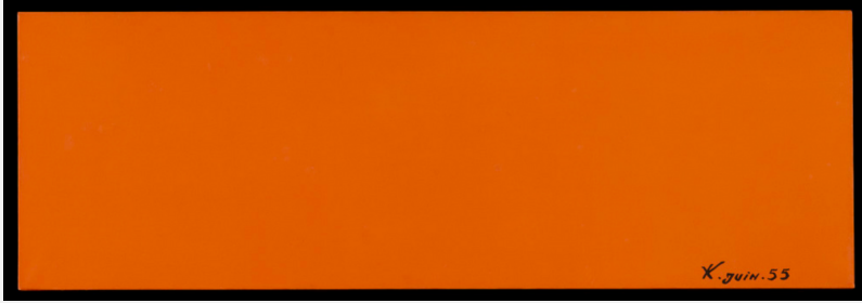
Yves Klein, Monochrome orange , juin 1955