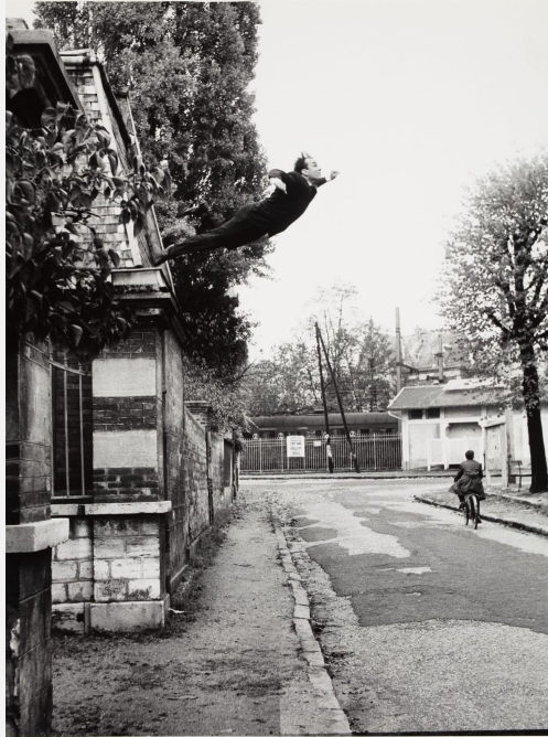
Saut dans le vide d'Yves Klein, Fontenay-aux-Roses, 1960