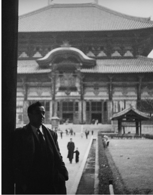
Yves Klein au Japon, 1953