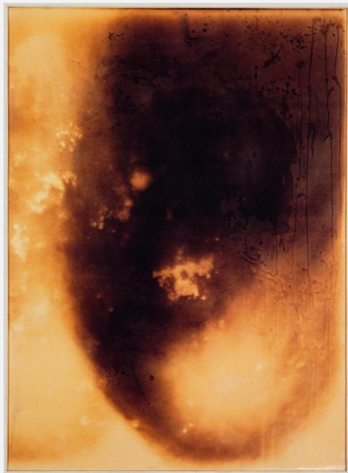
Yves Klein, F74, Peinture de feu sans titre , 1961