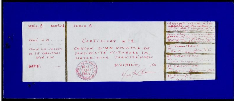
Yves Klein, Chèque , 1959